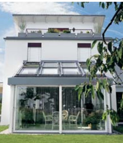
Wintergartenlösung mit Schüco EasySlide Conservatory solution using Schüco EasySlide