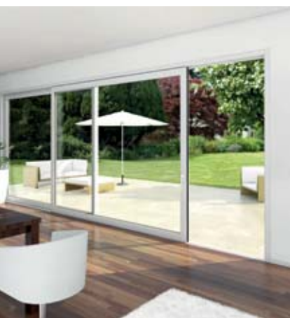
Ansicht von innen View from inside